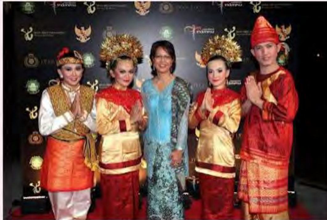
La Embajadora de Indonesia con las bailarinas de danza de Reog