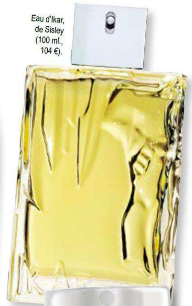
Eau d'Ikar, de Sisley (100 ml., 104 €).