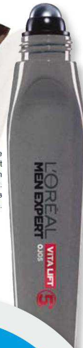
Contorno de ojos Vita Lift de Men Expert. L'oréal Paris (13,99 €).