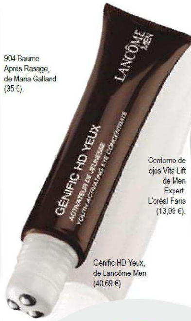
Génific HD Yeux, de Lancôme Men (40,69 €).