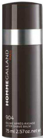
904 Baume Après-Rasage, de Maria Galland (35 €).