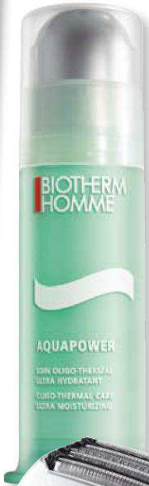
Aquapower, de Biotherm Homme (c.p.v.).