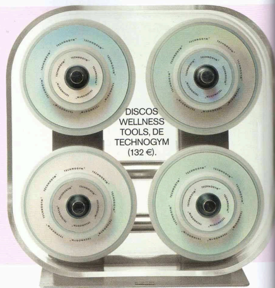
DISCOS WELLNESS TOOLS, DE TECHNOGYM (132 €).

Technogym te ofrece un servicio de entrenadores a domicilio que te elaboran un plan a medida, con o sin aparatología, para que redefinir curvas y reducir volúmenes sea más fácil. Más información: Tel. 900 898 899.