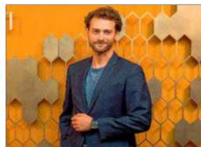
El actor Peter Vives.