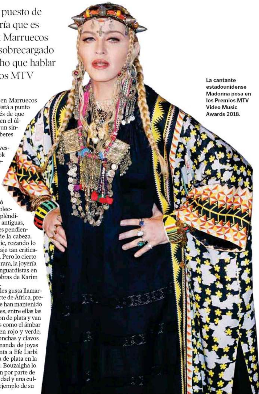
La cantante estadounidense Madonna posa en los Premios MTV Video Music Awards 2018.

Los amazigh (como a los bereberes les gusta llamarse) son los pueblos autóctonos del norte de África, presentes de Marruecos hasta Egipto, que han mantenido celosamente su lengua y sus tradiciones, entre ellas las vestimentarias. Las joyas bereberes son de plata y van acompañadas de otros complementos como el ámbar amarillo, el coral rojo, los abalorios en rojo y verde, monedas antiguas y a veces llevan conchas y clavos de olor. «Ahora hay mucha más demanda de joyas bereberes que hace unos años», cuenta a Efe Larbi Bouzalgha, propietario de una joyería de plata en la medina de la capital marroquí, Rabat. Bouzalgha lo ve como una especie de reivindicación por parte de las nuevas generaciones de una identidad y una cultura amazigh, que ve en la joyería un ejemplo de su historia y simbología.